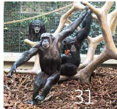
Familienbande bei den Primaten

Titelfoto: Simone Forcart-Staehelin