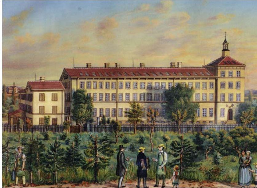
Eine idealisierende Darstellung der neu erbauten Seidenbandfabrik De Bary & Söhne (1854).

Heinz Polivka: Nein. Sie handelten mit allem: Getreide, Wein, Salz, Tabak, Baumwolle, Zucker, Kaffee, Metallen, Farbwaren, Käse, gedörrtem Obst, Holz, Vieh